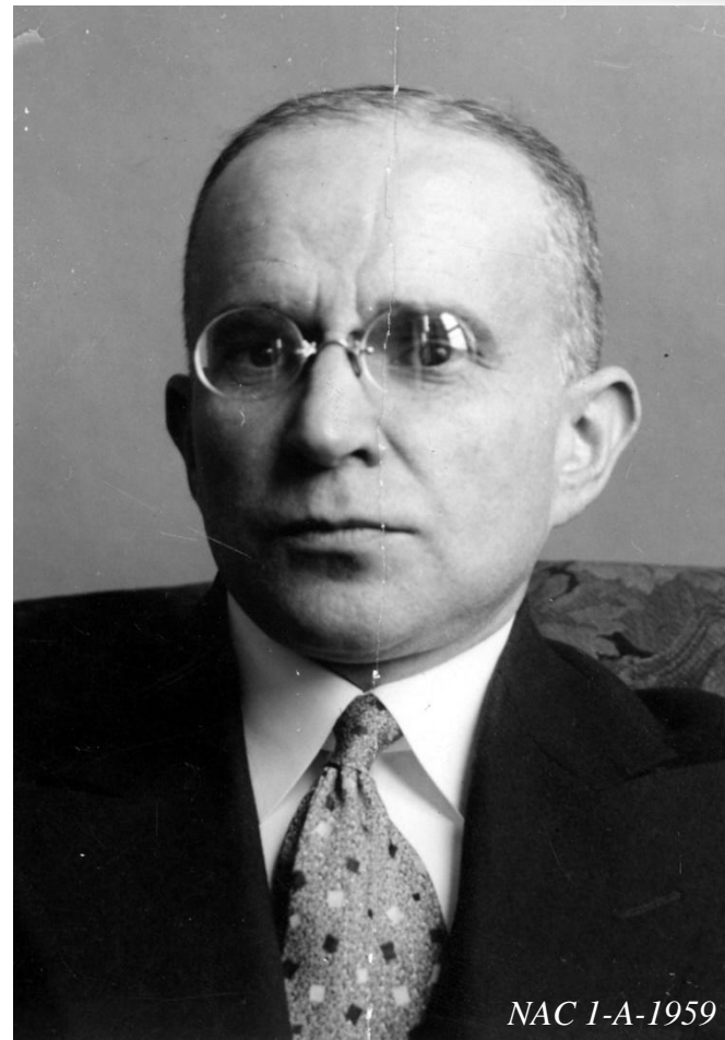
Inż. Michał Butkiewicz, Minister Komunikacji (1932-1935)