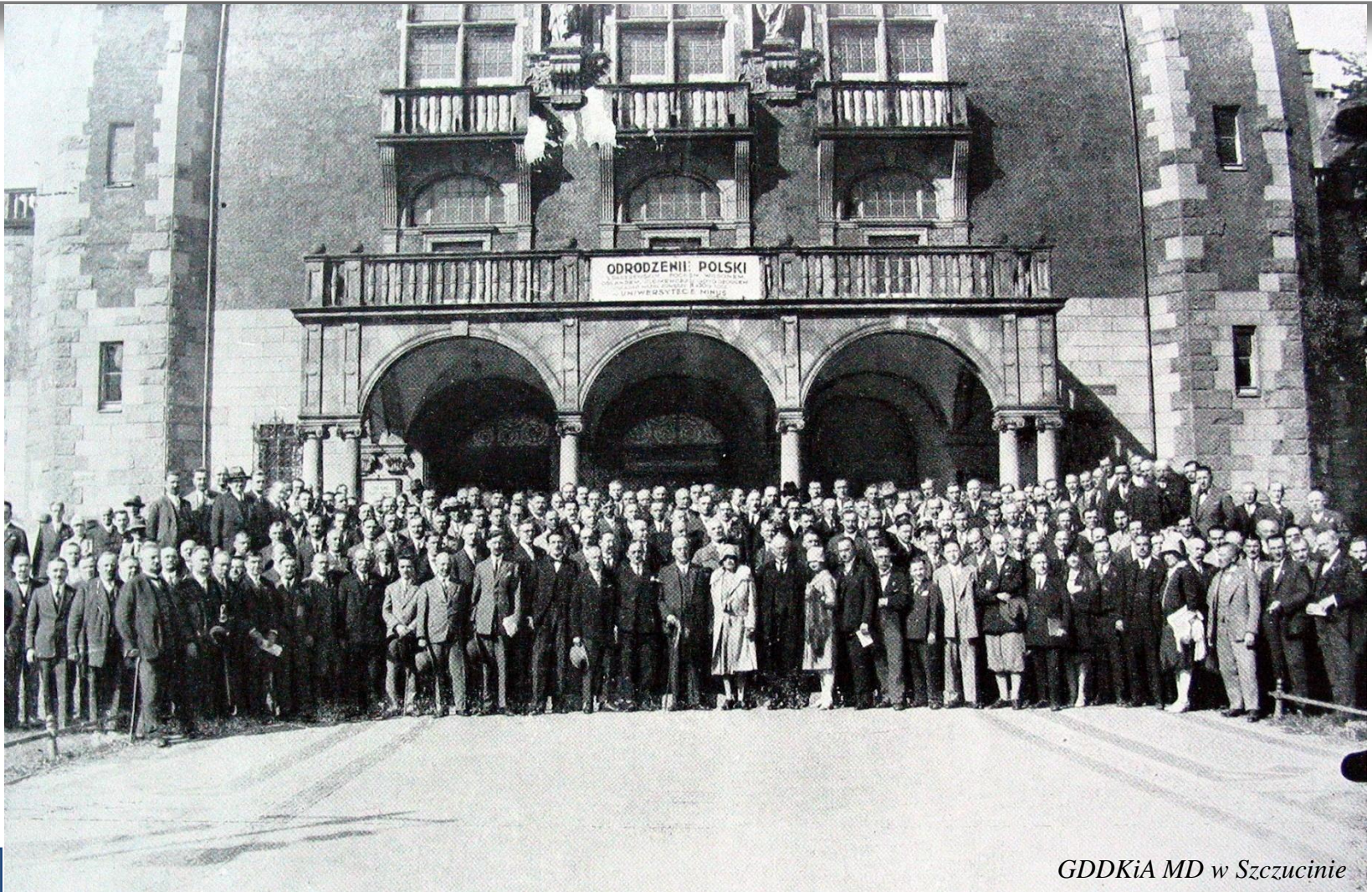
GDDKiA MD w Szczucinie