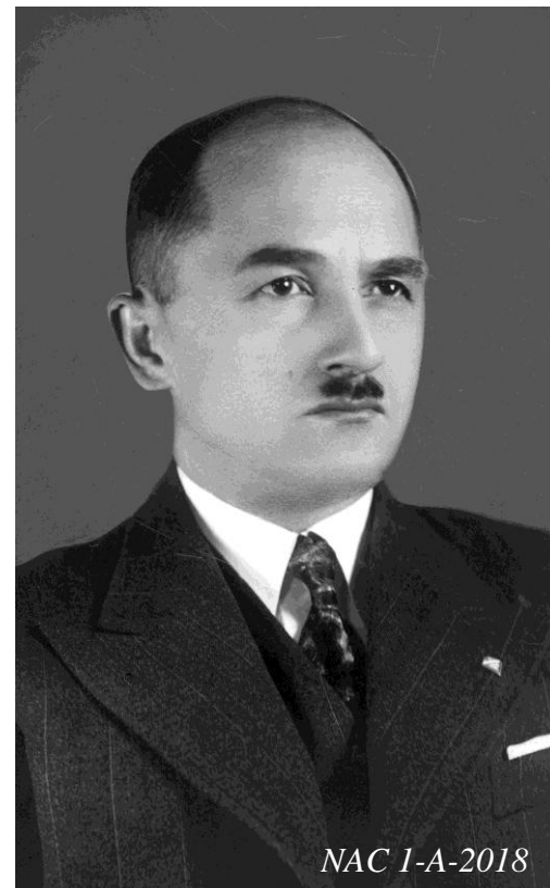
Płk Juliusz Ulrych, Minister Komunikacji (1935-1939)